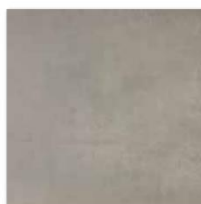
DAR44721 PEI 4 Ø 74 / m 2 mat | matt hnědo-šedá / brown-grey / brązonoszara коричневый-серый / gris-marrón