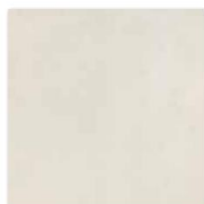
DAR44720 PEI 5 Ø 74 / m 2 mat | matt slonová kost / ivory / kość słoniowa слоновая кость / marfil