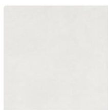
DAR44722 PEI 5 Ø 74 / m 2 mat | matt bílá / white / biela / белый / blanco