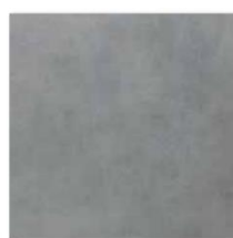
DAR44724 PEI 4 Ø 74 / m 2 mat | matt tmavě šedá / dark grey / ciemnoszara темно-серый / gris oscuro