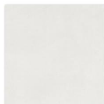
DAR44722 PEI 5 Ø 74 / m 2 mat | matt bílá / white / biela / белый / blanco